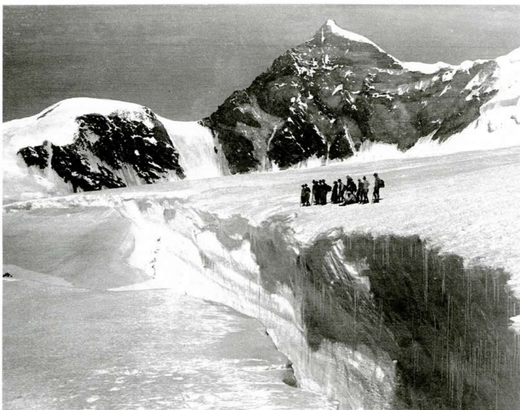
A sinistra, sosta sull'orlo del crepaccio (foto Valentin Curta, primi del Novecento, archivio Curta-Guindani)