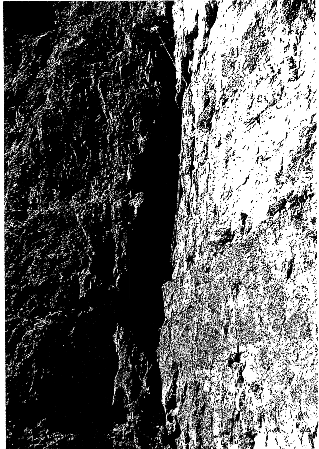
Tissi sulla fessura della Torre Venezia